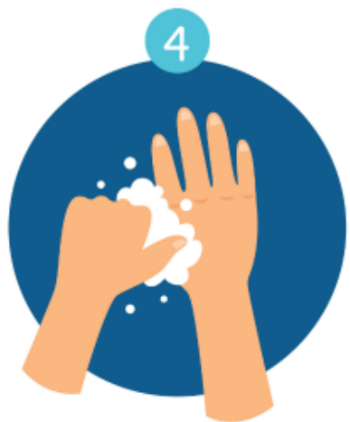
FOCUS ON THUMBS