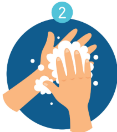
PALM TO PALM