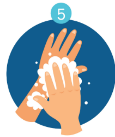
BACK OF HANDS