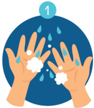
WATER AND SOAP