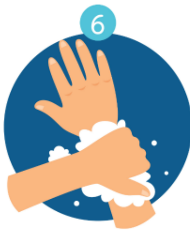
FOCUS ON WHISTS